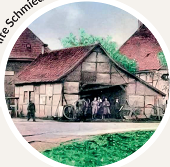
Alte Schmiede - Zeichnung 1942