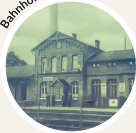
Bahnhof - erbaut 1872