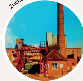
Zuckerfabrik von 1875